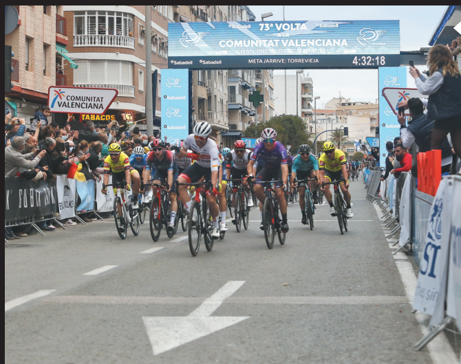
Los ciclistas en su llegada a la meta en la avenida Gregorio Marañón.