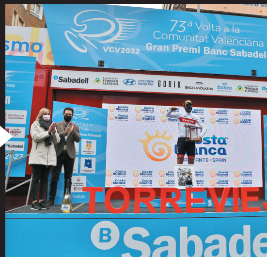
El ganador de la 4ª etapa, el italiano Mateo Moschetti, recibiendo el premio.