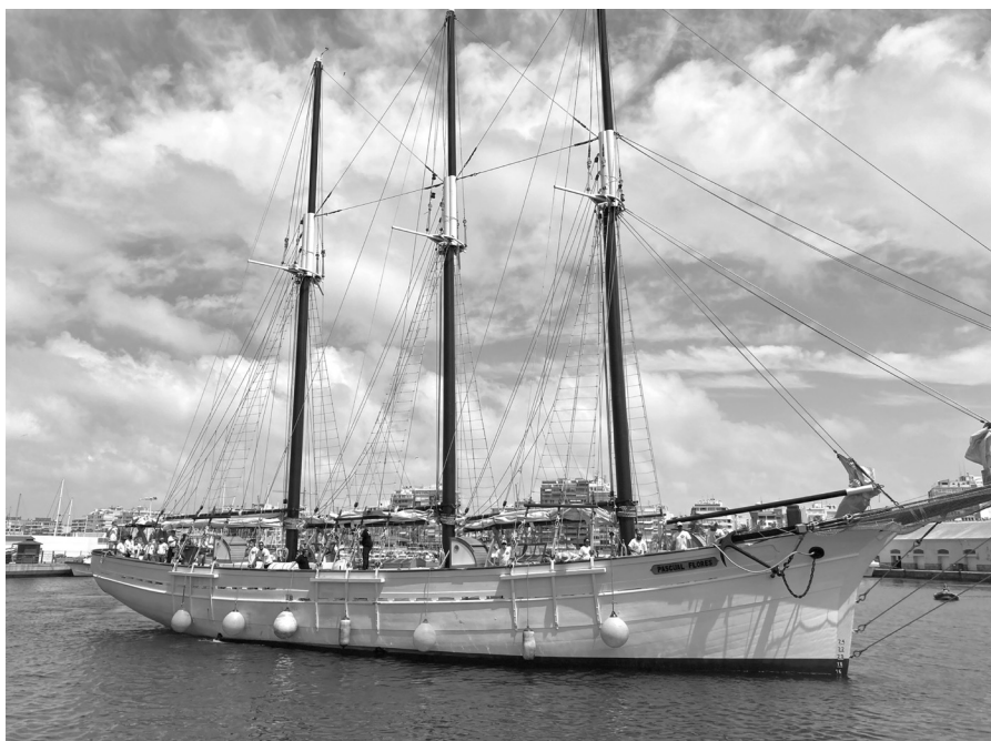
Imagen del velero Pascual Flores a su llegada a Torrevieja en octubre del año pasado.

A lo largo de todos los puertos visitados