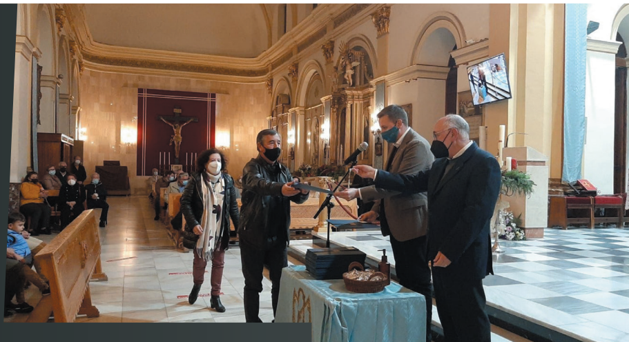
Momento de la entrega del reconocimiento a los benefactores del proyecto del nuevo camarín.