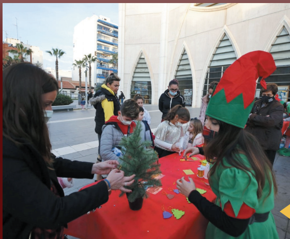
La Plaza de Oriente acogió el taller infantil "Arbolito de Navidad".