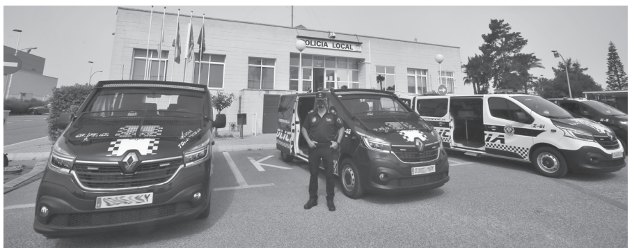
Foto de los últimos vehículos adquiridos por el Ayuntamiento, destinados a la Unidad de Diligencias y Atestados.