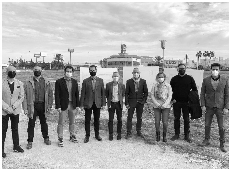
Autoridades y representantes de la comunidad educativa en la parcela donde se construirá el CEIP Amanecer.

En concreto, las actuaciones se llevarán a cabo en gran parte del IES Las Lagunas, en la sustitución de la cubierta del colegio Virgen del Carmen, en la reparación de apuntalamiento y ampliación del IES Libertas, y en la ampliación de un aula del IES Torrevejea.