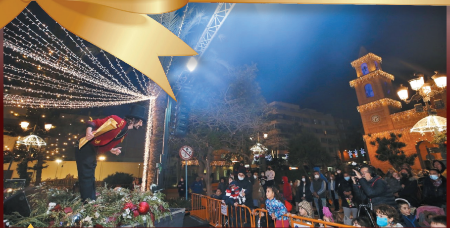
Un momento de la actuación de El Brujo en el escenario de la Plaza de la Constitución.