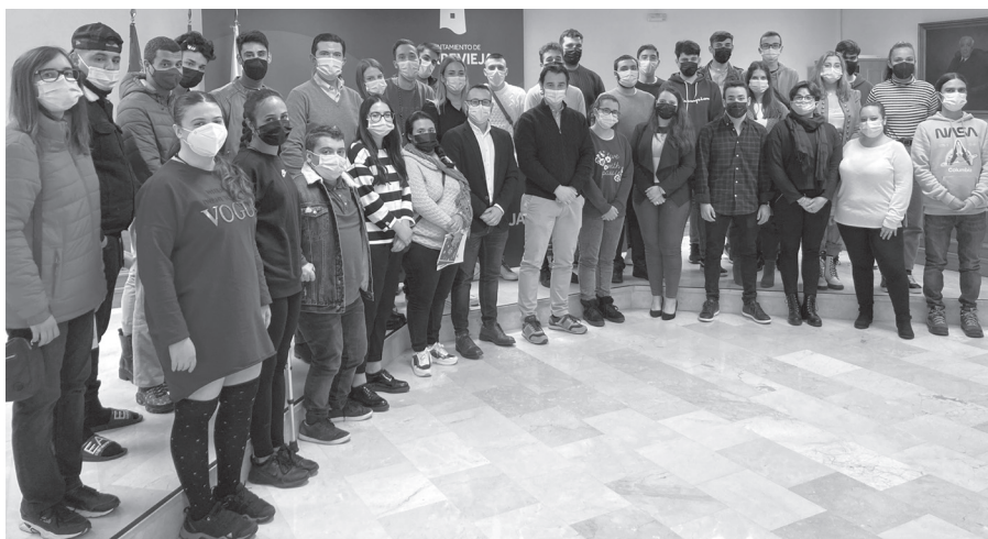
Foto de archivo de los jóvenes contratados este mes con el programa EMPUJU.

Por último, cabe destacar la contratación de 12 personas procedentes de colectivos vulnerables que sufren mayor dificultad o discriminación en el acceso al empleo (10 alumnos, un director y un docente) durante un periodo de un año, a través del Taller de Empleo "Vides de La Mata" con una subvención de 241.358 euros. Asimismo, a través del Taller de Empleo T'AVALEM FOTAV "Maestro Ricardo Lafuente", 12 personas también han sido contratadas gracias a la subvención de 241.358 euros, también a través de LABORA.