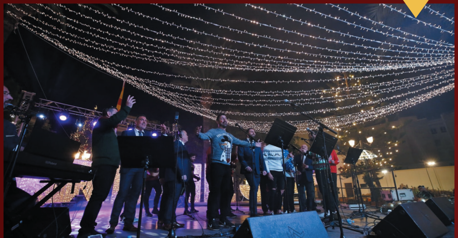
"Sette Voci" y "Los Sangochaos" divirtieron al público durante su recital navideño conjunto.