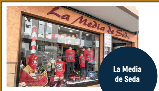
La Media de Seda