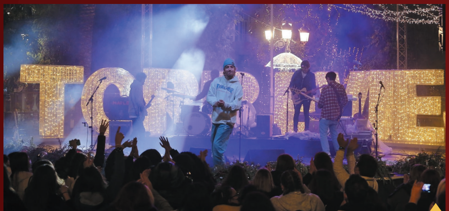
Actuación del grupo Marlon.