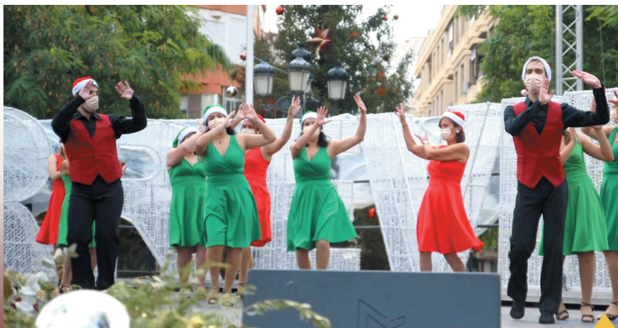
La Academia "Soul Dance" presentó una exhibición en la mañana del domingo.

Las actividades navideñas se desplazaron el martes hasta la Plaza de Oriente, en pleno corazón del barrio de La Punta, con el desarrollo del taller infantil "Arbolito de Navidad" que fue toda una atracción para un buen número de pequeños. También este miércoles, en la Plaza de la Constitución tuvo lugar otro taller, denominado esta vez "Bolas de Navidad".