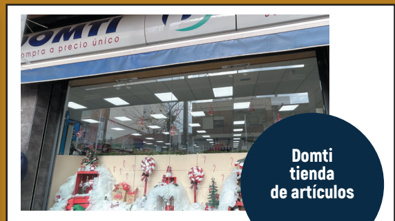
Domti tienda de artículos